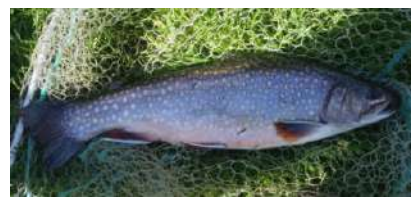
saumon des fontaines