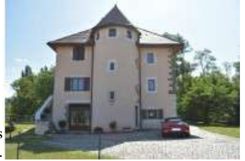
Maison des Templiers La tour servait de prison.

Durant cette période, la peste sévit et tue deux tiers de la population du village. La famine est une fois encore de retour. Après la dernière peste en 1630, le village est brûlé et les habitants qui restent construisent un oratoire, lieu de prière pour s'attirer la bienveillance et la protection d'un dieu.