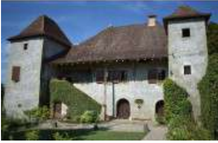
Chateau de Fesigny

construisent notamment un hôpital. Ils resteront jusqu'en 1576.