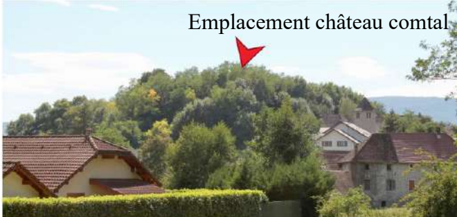
Emplacement château comtal

Par la suite, sous le régime des Burgondes puis des Francs et des Carolingiens, le village continue de s'agrandir et des maisons fortes sont construites. Mais à partir du neuvième siècle, le pouvoir est affaibli et les guerres se succèdent entraînant des pillages et les disettes. Un premier château est construit en bois avant d'élever le premier château comtal en pierre au onzième siècle mais qui est en ruine depuis 1730. C'est la première habitation des Seigneurs d'Hauteville, elle surveillait la route qui menait à Genève.