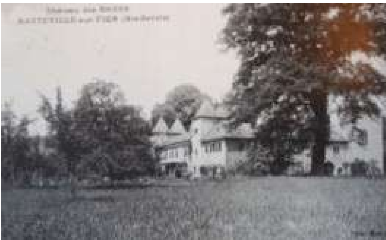
Château des Onges

Au vingtième siècle, il est racheté par le général Devigny, un compagnon d'armes du général De Gaulle qui séjourna donc à Hauteville sur Fier chez son ami.